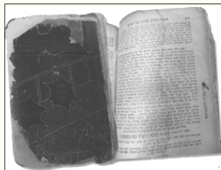
דער בלאט פון וועלכע מרן מהרי"ד זי"ע האט געזאגט די תפילה פאר מנחה פון יום כיפור (בני דיי זייט זעהט מען דאס סטעמפל פון ר' ברוך בארד ז"ל)